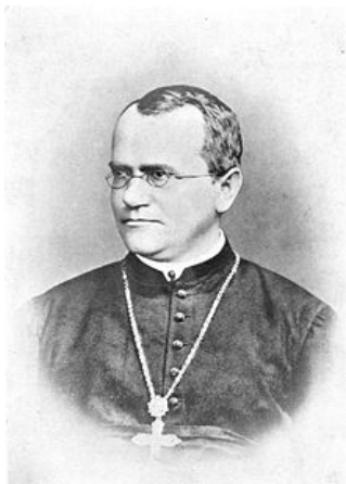
Augustiański zakonnik, prekursor genetyki